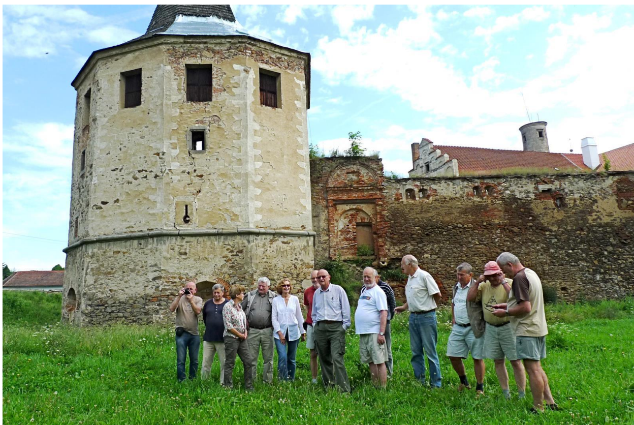
A nakonec, hezký snímek zřícenin v Červené Řečici.