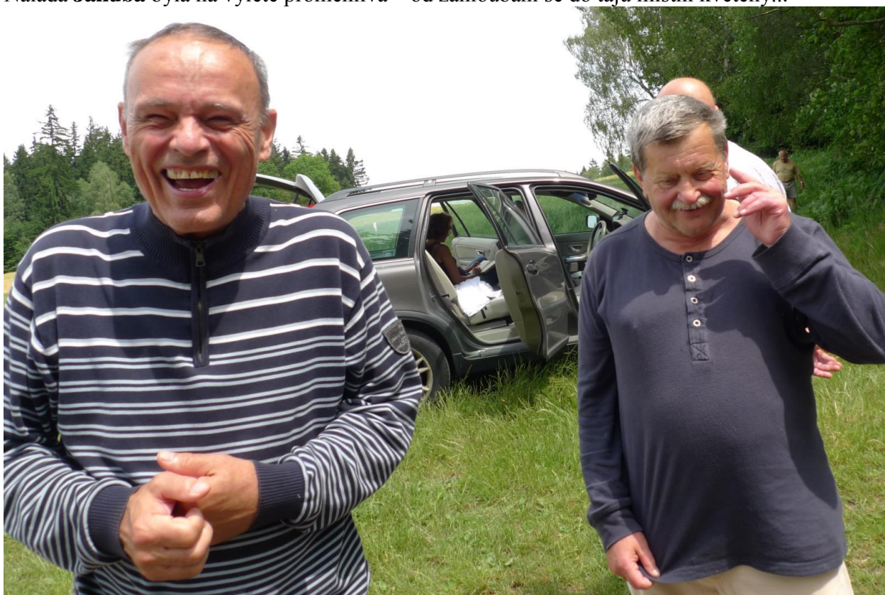
až po eufórii z nějakého žertu.