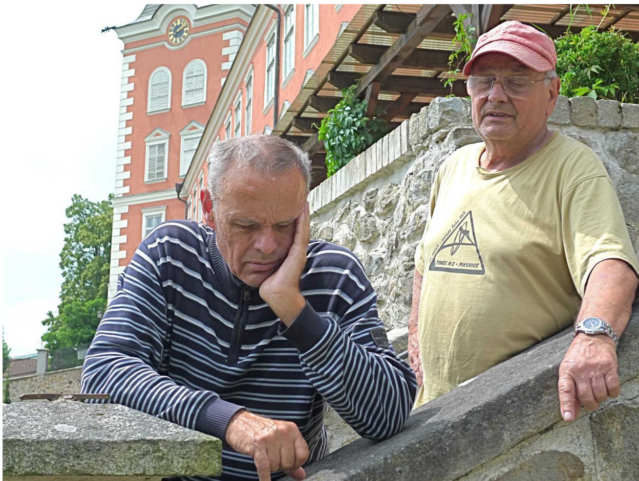
Nálada Jakuba byla na výletě proměnlivá – od zahloubání se do tajů místní květeny...